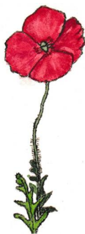
Klaproos (de kleine -) Papaver dubium