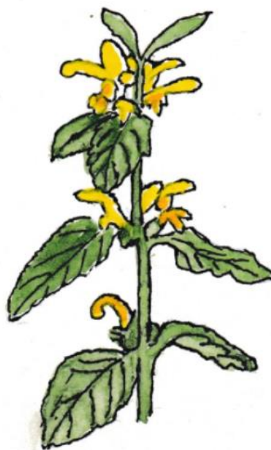
Gele Dovenetel Lamium galeobdolon