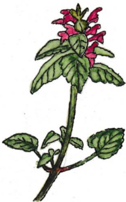
Paarse Dovenetel Lamium purpureum

De kleur waarmede ik mij sier, of wit of paars of helder geel, vertelt u dat ik welig tier en daardoor juist de mens verveel. Nochtans, o mens, versmaad mij niet, een dovenetel kan ook iet. Trek mijn jonge blaadjes af: een handvol bij uw sla laat vele pijn verdwijnen dra.