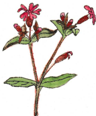
Dagkoekoeksbloem Melandrium rubrum