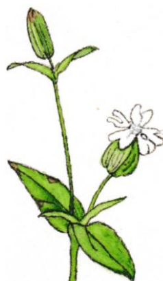
Avondkoekoeksbloem Melandrium album